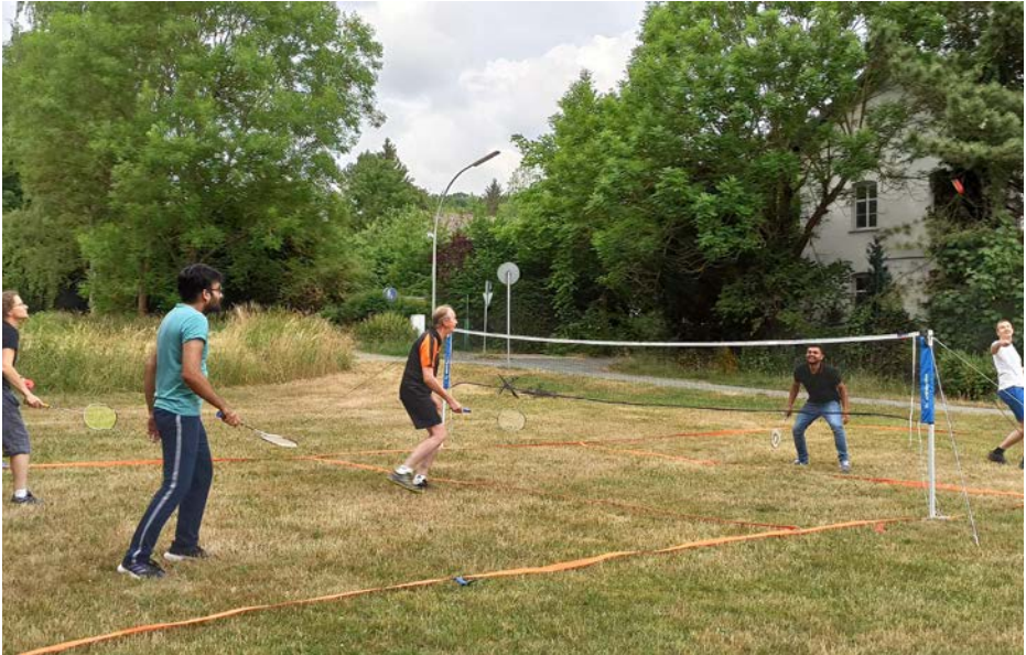
Erste Versuche im AirBadminton am Lettenbachsee

Im Sommer letzten Jahres konnten wir mit den vom Bayerischen Badminton-Verband überlassenen AirBadminton-Sets einige Trainings auch im Freien gestalten. AirBadminton ist eine neu entwickelte Variante des klassischen Badminton,